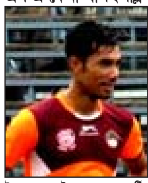
ইফাল, সেপ্টেম্বৰ ৩০ : সেপাটিং এসোসিয়েসন কোংবা মৰুনা থাদেৰকপা চেৰোলা অমগী মতুং ইয়া ইন্দিয়ানী ক্ৰুৰ কয়দা শৰুক য়াৰুৰবা মনিপুৰদগী এ এক সি-ডি লাইসেন্স হোস্তাৰ খাংজ সৰন সিংহু হিৰো ইন্দিয়ান সৰ্ভোস ট্ৰোফিকী টিম কোচ ওইনা খল্লকপদা ওল মনিপুৰ ফুটবল এসোসিয়েসনসু এ এ কেগী মাইকেগী খাগৎলিক্ৰি

কম্পিটিচন অসিদা নিপাল্লিক ওফ কোয়িৰানা গোস্, চাইনানা সিলভাৰ অমদি চাইনানা সিলভাৰ ফংবা ঙ্গমখিবনি। হৌজিক ফাওবগী ওইনা ইন্দিয়ানা গোস্ ১০০, সিলভাৰ অমদি ব্ৰোঞ্জ ১৪ / ১৪ পুৰা মেডেল ৩৮ ফংলগা মৰিশ্ববা পোজিসনদা লৈরি। চাইনানা গোস্ ১১১, সিলভাৰ ৬৬ অমদি ব্ৰোঞ্জ ৩৩ ফংদুনা আহনবা অমদি জপাননা গোস্ ২৪, সিলভাৰ অমদি ব্ৰোঞ্জ ৩৮ / ৩৮ ফংদুনা ২শুবা লৈরি। গেমস অসিদা ইন্দিয়ানা ছুট্টিংদা গোস্ ৬, সিলভাৰ ৮ অমদি ব্ৰোঞ্জ ৬ ফংদুনা ছাইদগী মেডেল লৌবা ডিপিপিন ওইরি।