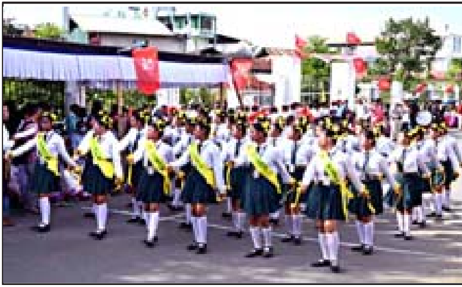
ইরাবত সেলেব্ৰেশন কন্মিতিনা শিনবা ইরাবত দে গী থৌৱমদা মাৰ্চ পাসকী কন্মিটেশ্বনটা সলামি পিখিবা

ইন্ফাল, সেপ্তেম্বৰ ৩০ : হৌখিবা পুং ২৪ অসিদা মনিপুৰদা মীওই ১২১ টেট্ট ভৌবদা নৌনা পোজিটিব ওইবা অমত্তা যাওখিদ্দে। কোভিড ১৯ কস্মন কন্ডোল রুগমণী চেৱোলদা ওসিগী ওইনা মীওই ৪ দিসচাৰ্জ তৌখি। এষ্টৰিৰ কেসভা লায়োংদুনা লৈৱিবা অসি মীওই ৯ খত্তা ওইইৰে। ৱিৰমস অমসুং জেনিমসকী কোভিড ৱাৰ্ডশিংদা অনাবা অমত্তা লৈৱে। এষ্টৰিভা লাইয়েংলিবা মীওই ৮ দি হোম আইসোলেশ্বন লৈৱগা লায়োংবনি। সেপ্তেম্বৰ ৩০ ফাওবদা ভেক্সিন কাপথোকপা মীশিং ৩২৩ ৬৩৭১ যৌশ্ৰে হায়রি।